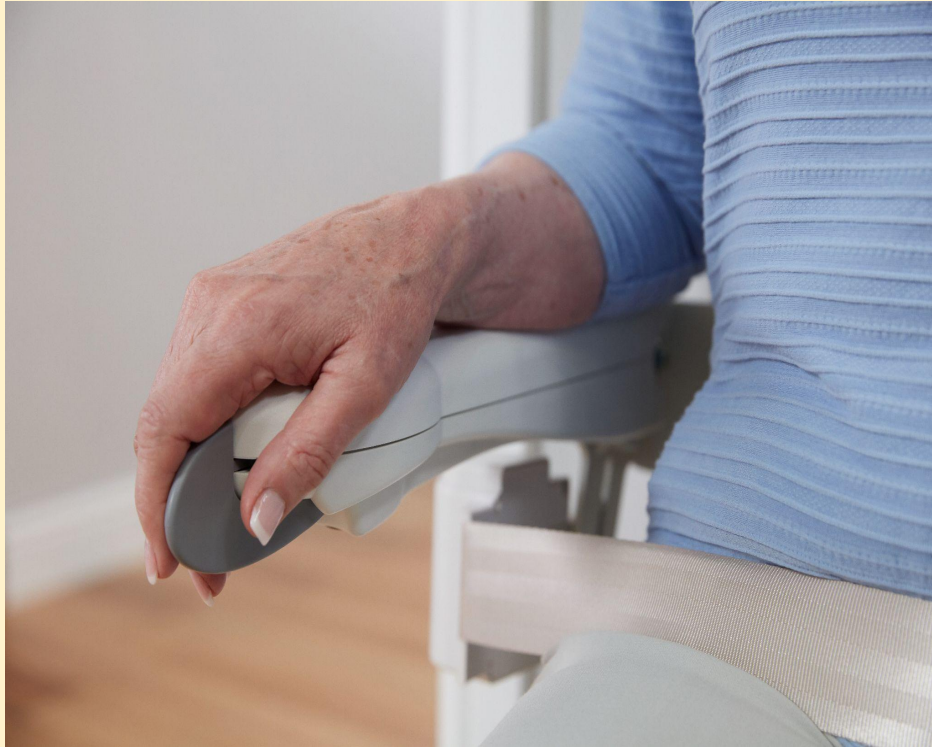
Fahrbefehlsgeber in der Armlehne