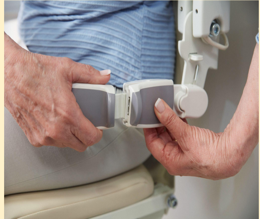
Sicherheitsgurt zum anschnallen