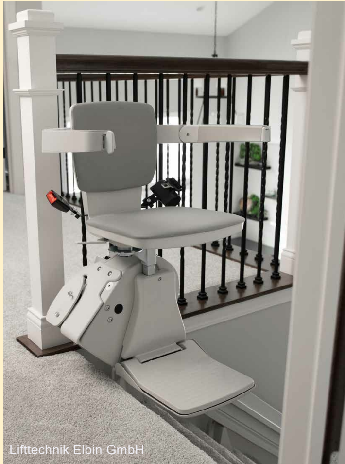
Liftechnik Elbin GmbH

Der Treppenlift nicht nur für schlanke Menschen!