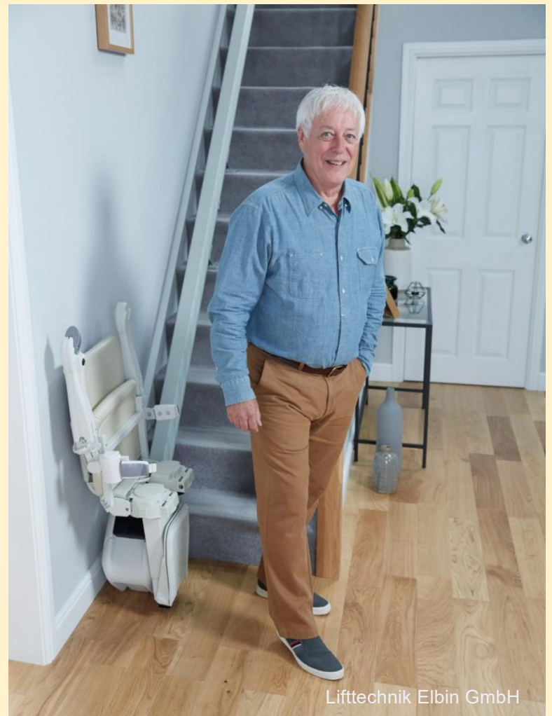
Liffttechnik Elbin GmbH