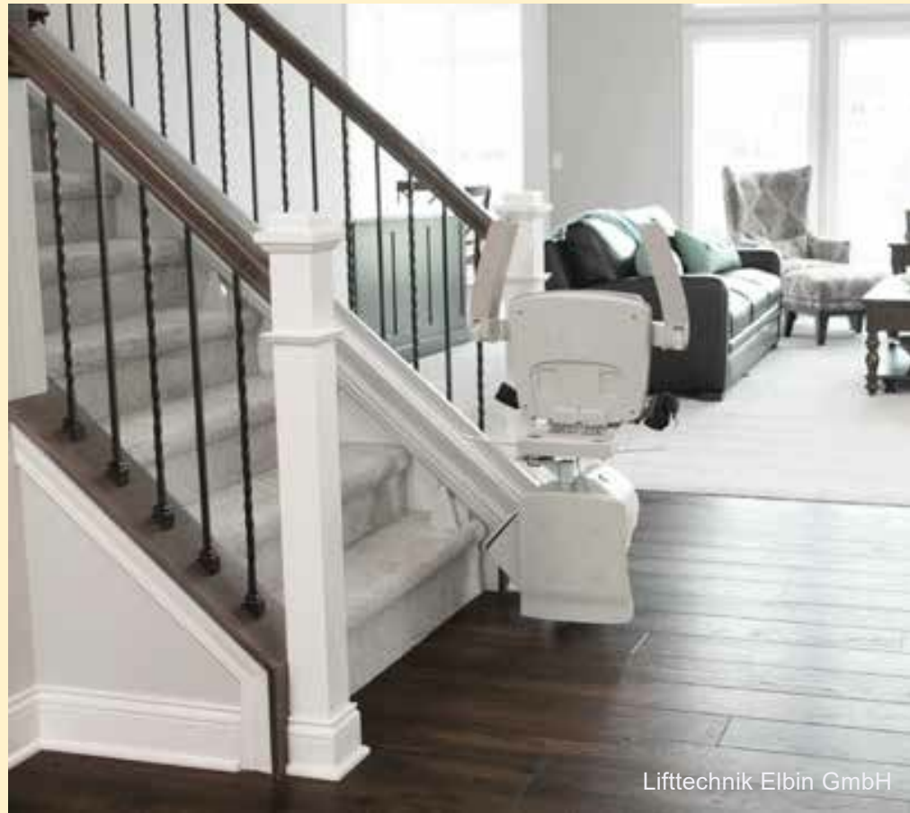
Lifttechnik Elbin GmbH