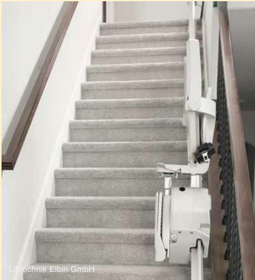
Lifttechnik Elbin GmbH