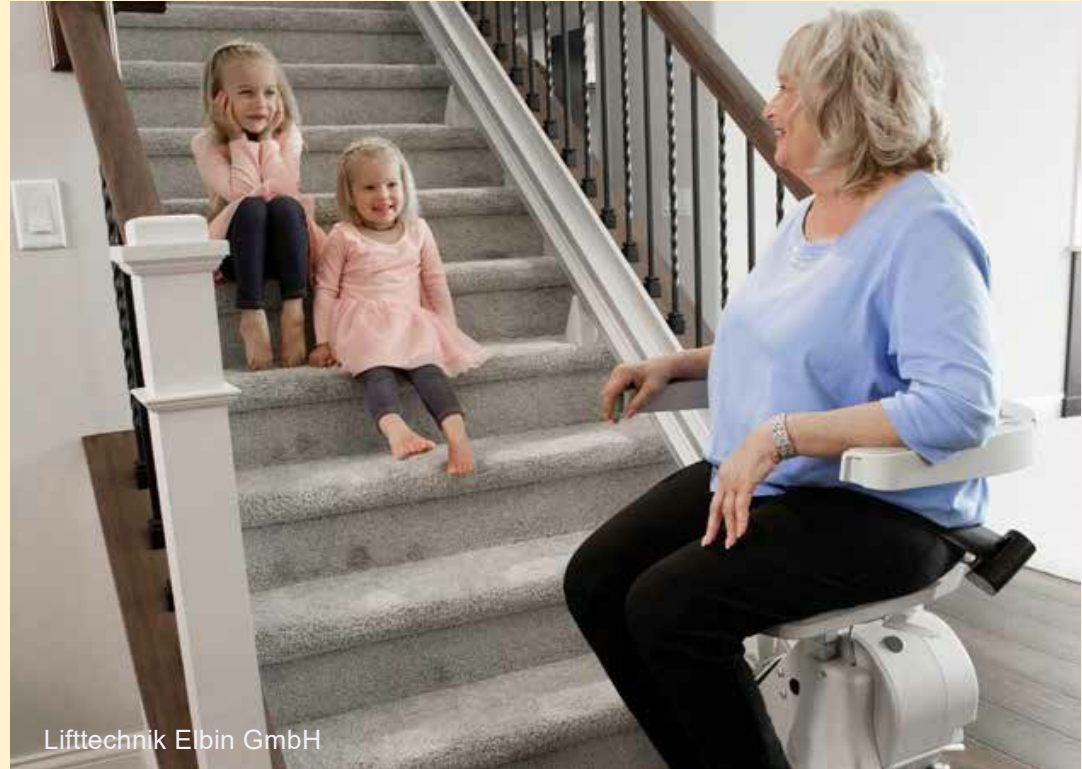
Liftechnik Elbin GmbH