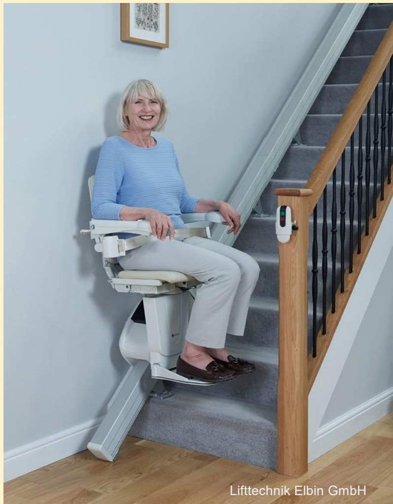
Liffttechnik Elbin GmbH